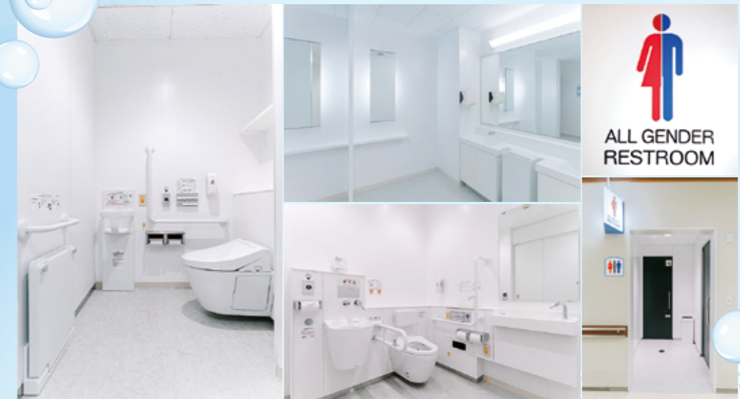
左/広々とした空間に、手すりやフィッティングボード、ベビーチェア、荷物置場などが備わった多機能なトイレ。中央上/明るく清潔感のある洗面エリア。中央下/オストメイト対応の安全性と利便性を高めたバリアフリートイレ。右上/オールジェンダートイレのマーク。右下/出入りしやすいスライドドアとわかりやすいサインのオールジェンダートイレ。

ご利用いただいた方々より「とてもキレイになった」、「感激した」とお褒めのお言葉をいただいています。その一方で、今回の改修整備では一部改修にとどまった外来トイレや、工事対象に含まれていなかった病棟内トイレおよび浴室設備についても、改善要望のお声をいただいています。引き続き、患者さんが安心・安全な環境で治療に専念できるよう、より良い療養環境整備を進めてまいります。