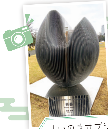
しいのきオブジェ

金沢の街なかには工芸の街らしく多くのオブジェが設置されています。今年3月下旬には、しいのき迎賓館緑地に新しい作品が設置されました。