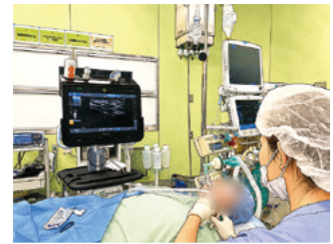
超音波ガイド下神経ブロック

外科系各科と密接に連携しながら、安全で質の高い周術期医療を提供し、患者さんの命と安心を支えています。