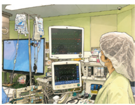
術中モニタリング

麻酔科医は、手術という大きな負担にさらされる患者さんの身体を、見えないところで支えています。