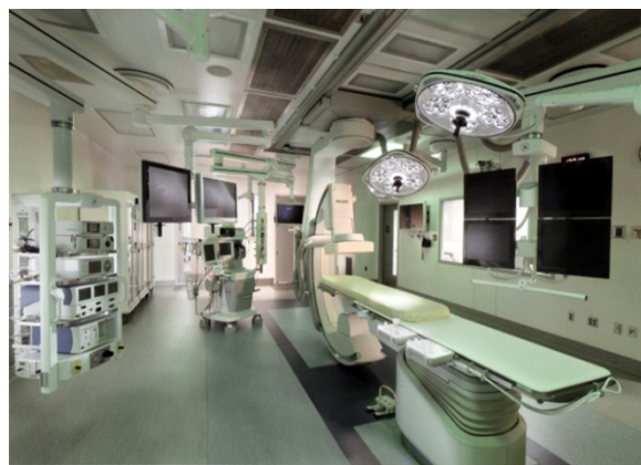
（ハイブリッド血管撮影室イメージ）

ハイブリッド血管撮影室 って何ですか？自転車をこいで発電しながら血管撮影をするの？いえいえそうではありません。何と何のハイブリッドかという、 部屋の環境 （清潔度・照明・麻酔器など）と、治療に必要な レントゲン装置 が合体しているのが、最新鋭のカテーテル血管撮影室（ ハイブリッド血管撮影室 ）というものです。心臓や血管の病気は、これまでの外科的手術に代わって、カテーテルを用いた血管内治療が行われることや、両者の併用療法を行うことが増加してきています。これまでこのような治療を行う場合、清潔環境がより必要な治療は手術室で、血管情報がより必要な治療はレントゲン室で別々に行われてきました。これらの治療がハイブリッド血管撮影室で行われることにより、これまで以上に精度の高い治療が安全・確実にできるようになります。さらに新規の治療手技の中にはハイブリッド血管撮影室の存在が前提となるものもあり、ますます地域医療レベルの向上に貢献できるものと考えられます。ご期待ください。