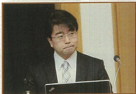
「肺がん分子標的薬治療のおはなし」