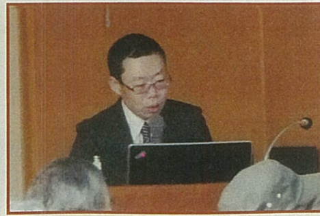
「がん化学療法のおはなし」