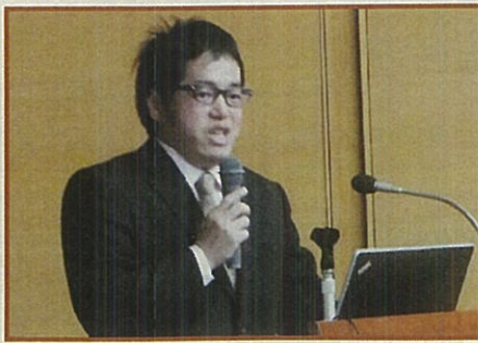
「乳がん薬物療法のおはなし」