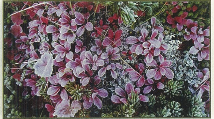
「ウラシマツツジの霜」