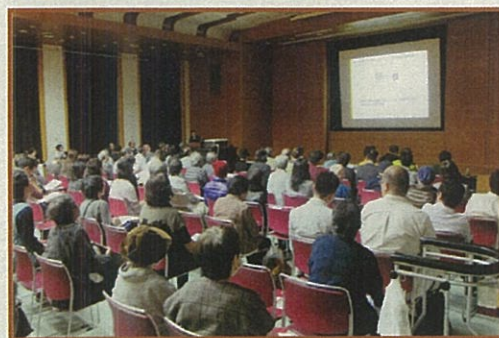
講演会会場の様子

また、一般市民の方には年2回の市民公開講座を開催しております（写真）。本年10月18日には病院祭と同時開催し、「最先端の抗がん剤治療」をテーマに①肺がん分子標的薬治療のおはなし、②乳がん薬物療法のおはなし、③がん化学療法のおはなし、を3名の講師にわかりやすく解説していただきました。市民の方にアンケート調査をして、日頃疑問に思うことや心配なことをテーマに講師陣を選定していく予定です。今後の予定等については病院ホームページをご覧ください。