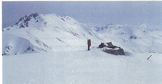
別山からみた立山、室堂平(写真2)