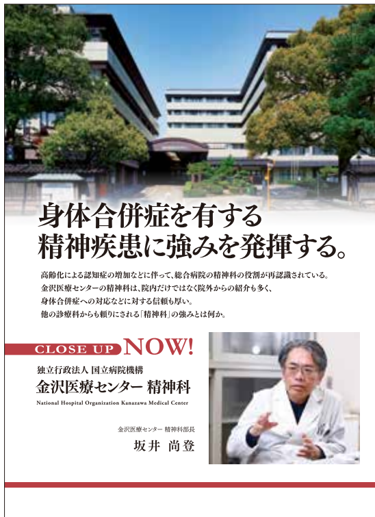
[SENSHIN 59号 P.30-31 掲載]