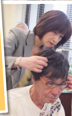
スヴェンソンさんも参加してくれました。