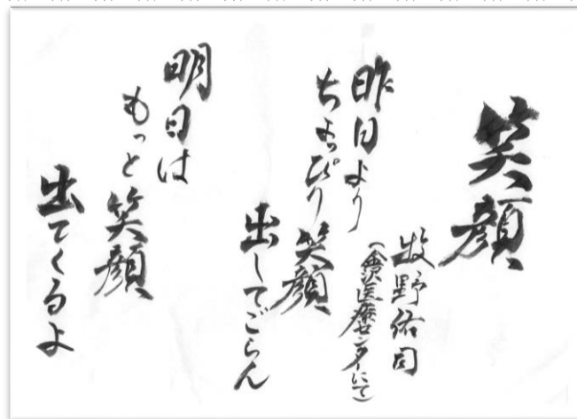
シリーズ牧野さん語録(7)